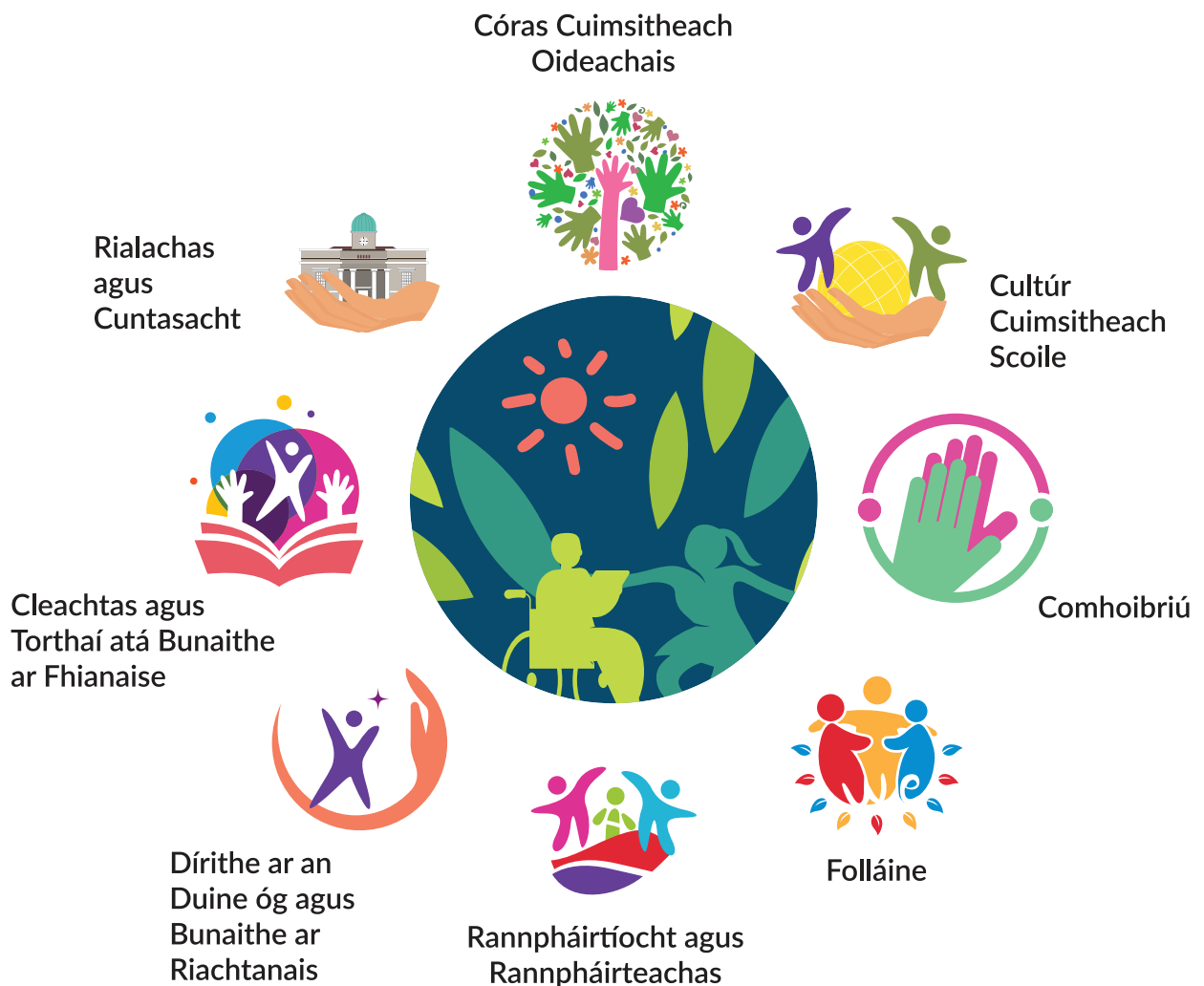
Fíor 1: Na príomhphrionsabail le haghaidh tacú le soláthar cuimsitheach oideachais scoile uile

Is le hocht bprionsabal a sholáthraítear an bunús do scoileanna chun cur chun feidhme agus forbairt leanúnach a gcuid córas, struchtúr, cleachtas agus beartas a threorú chun tacú le cuimsiú gach linbh, lena n-áirítear iad sin a bhfuil riachtanais speisialta oideachais acu. Tá na prionsabail sin léirithe i bhFíor 1 thíos. Is féidir le scoileanna soláthar cuimsitheach tacaíochta teagaisc oideachais speisialta a athbhreithniú, a fhorbairt tuilleadh agus a chur chun feidhme do leanaí a bhfuil riachtanais speisialta oideachais acu trí phlé leis na hocht bpríomhphrionsabal agus leis na táscairí gaolmhara ar chleachtas éifeachtach. Is féidir go mbeidh riachtanais speisialta oideachais ag leanaí ar fud roinnt réimsí, lena n-áirítear litearthacht, uimhearthacht, teanga agus cumarsáid, caidreamh sóisialta, forbairt mhothúchánach, forbairt chéadfach agus forbairt fhisiciúil.