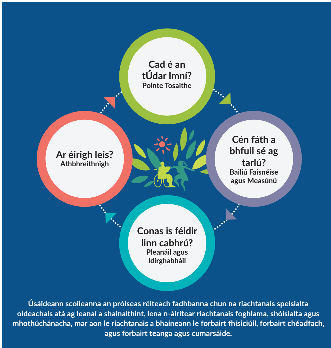
Fíor 3 - An próiseas réiteach fadhbanna

Sa rannán seo, cuirtear freisin leis an bpróiseas le haghaidh riachtanais a shainaithint ar fud an Leanúntais Tacaíochta, mar atá leagtha amach i Rannán 4 de na Treoirlínte, agus le haghaidh freagairt do na riachtanais sin, agus ba cheart é a úsáid i gcomhar leis na Treoirlínte le linn beartais chuimsitheacha a fhorbairt agus chun machnamh a dhéanamh ar chleachtais chuimsitheacha scoile. Cuirtear béim ag gach leibhéal den Leanúntas Tacaíochta ar chleachtais chomhoibríocha atá dírithe ar an leanbh agus atá bunaithe ar láidreachtaí agus ar riachtanais, ar cleachtais iad a éascaíonn cuimsiú gach linbh a bhfuil riachtanais speisialta oideachais acu. Tá an próiseas réiteach fadhbanna léirithe i bhFíor 3 thíos.